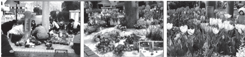
志徳（北九州）ふれあいサロン「十八の会」

応募作品はURコミュニティのホームページ（ http://www.ur-cm.co.jp/ ）に掲載予定です。