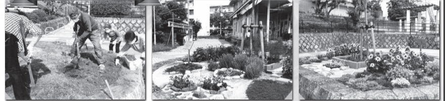
西大和片岡台（奈良）片岡台団地自治会 ふれあいガーデン