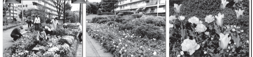
千葉ニュータウン清水口（千葉北）花の和