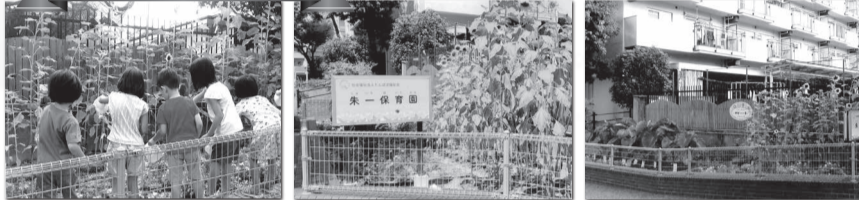
壬生坊城第二（京都）朱一保育園