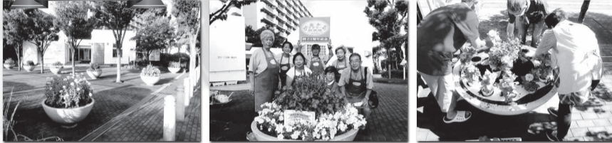
金沢シーサイドタウン並木一丁目第一（横浜南）並木フลาวークラブ