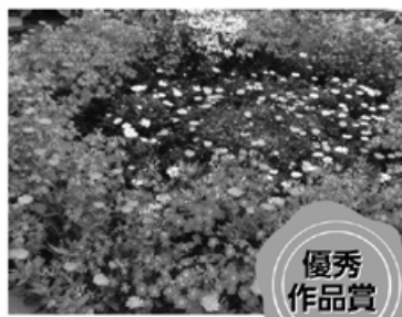
五輪団地: 環境アセスメント倶楽部