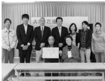
港南台かもめ団地