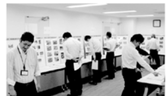
URコミュニティ社員による審査。 たくさんあって迷います。

※入賞作品の写真は一部です。評価は活動記録と写真を総合的に判断して行っています。